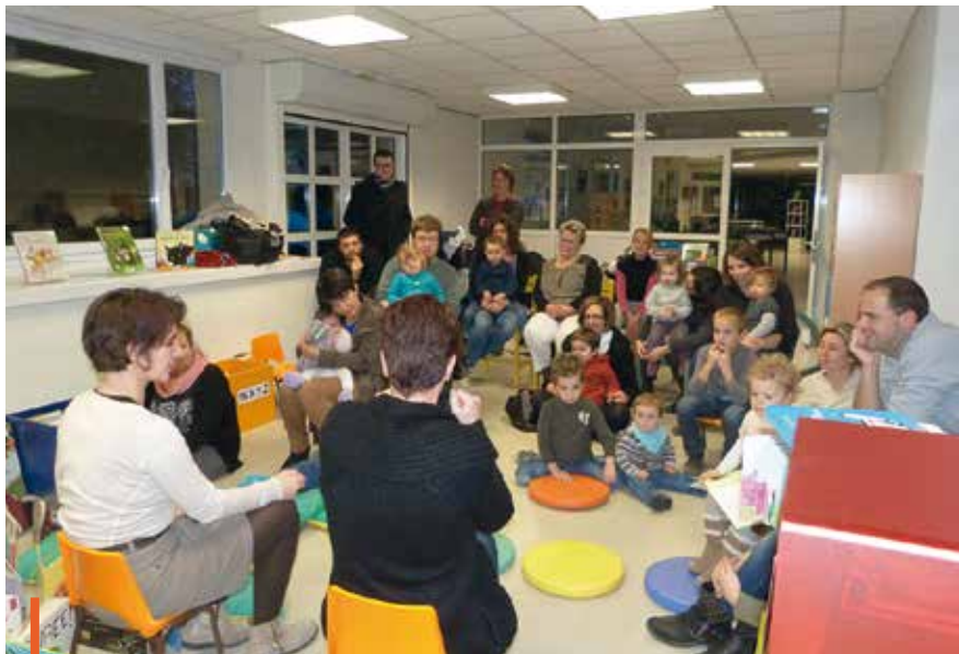
Enfants, parents et personnel de la Maison de la Petite Enfance se sont retrouvés à la Médiathèque pour profiter de quelques belles histoires.