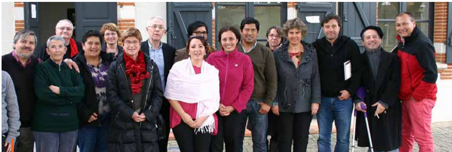
Le 12 février, nous avons eu le plaisir d'accueillir une délégation de conseillers municipaux chiliens des villes de Quilpué, Hualpén et Talcahuano. Après Madrid et Bilbao, Villeneuve-Tolosane était la troisième étape de leur séjour européen visant à connaître d'autres modes de fonctionnement municipaux. Une rencontre aussi enrichissante que conviviale.