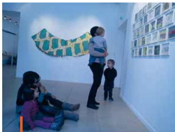
Pour favoriser l'éveil artistique des tout-petits, le RAM organisait des visites de l'exposition « Chocs et traces » au Majorat et des ateliers de peinture. Des moments de découverte et d'ouverture appréciés par tous.