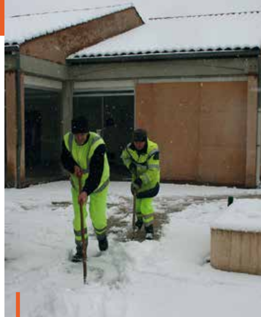
Coup de chapeau aux agents municipaux et de Toulouse Métropole qui ont été fortement mobilisés les 3 et 4 février pour déblayer les grands axes de circulation et les abords des écoles et bâtiments publics.