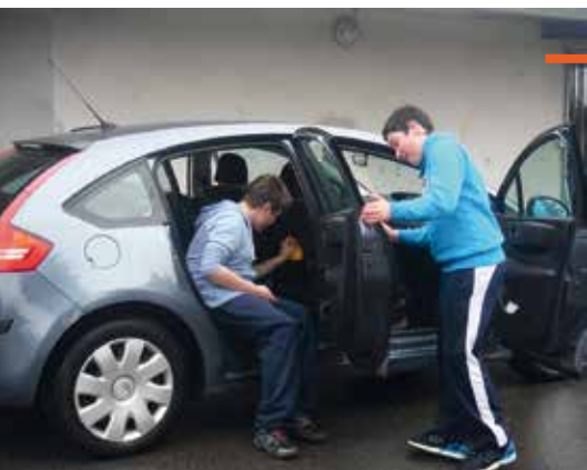
Les adhérents du Centre animation jeunesse « mouillent la chemise » pour financer leur séjour à Paris au printemps ! Lors des vacances de février, ils proposaient aux Villeneuvois de nettoyer leur voiture contre une participation libre.