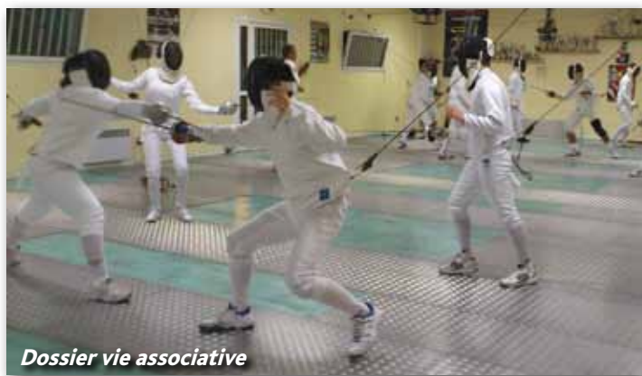
Dossier vie associative