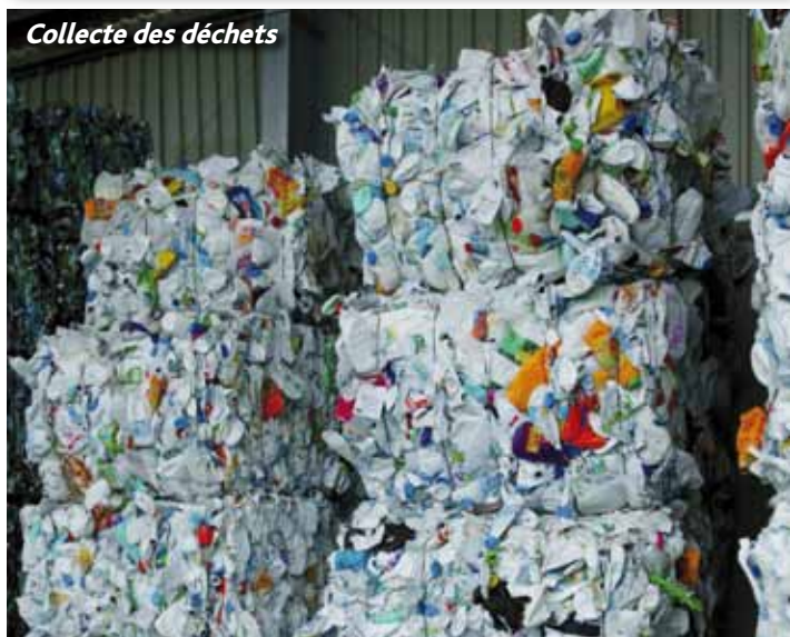
Collecte des déchets