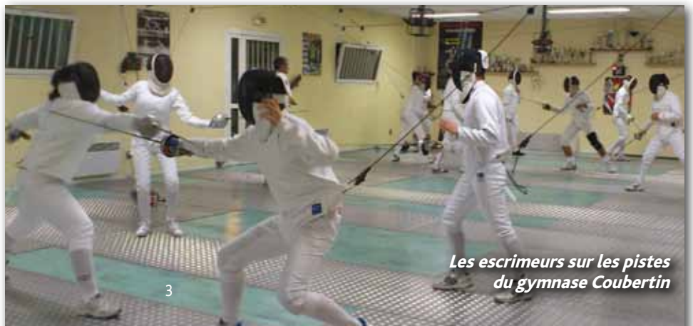
Les escrimeurs sur les pistes du gymnase Coubertin

Quelques disciplines rares, telles que l'escrime, sont représentées à Villeneuve-Tolosane. Certaines, comme le « martial arts tricks » de Cascade 31 (voir page 5), sont tellement peu représentées en France qu'elles attirent dans notre région des pratiquants prêts à déménager pour vivre leur passion !